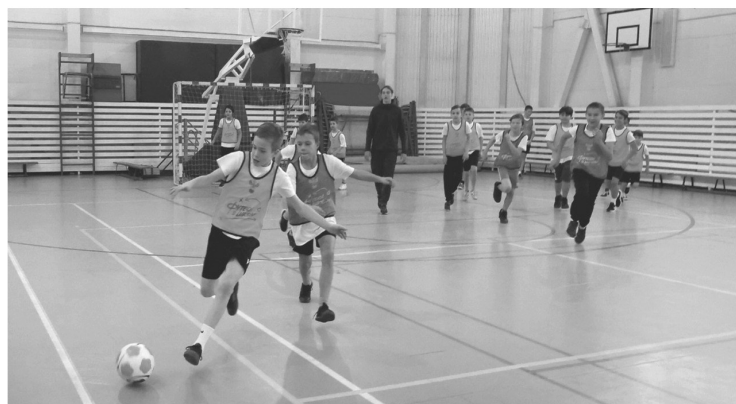
Игроки ФК «Ленинградец» научили школьников приёмам из большого футбола

По традиции всё начинается с разминки и теоретической части. Как правильно разогреться перед игрой? Как остановить мяч в два касания? Советы ма-