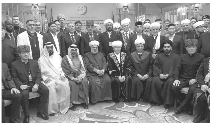
Участники конференции «Традиционные религии за сильную Россию»

Не удивительно, что Ленинградская область активно включилась в празднование 1100-летия принятия ислама Волжской