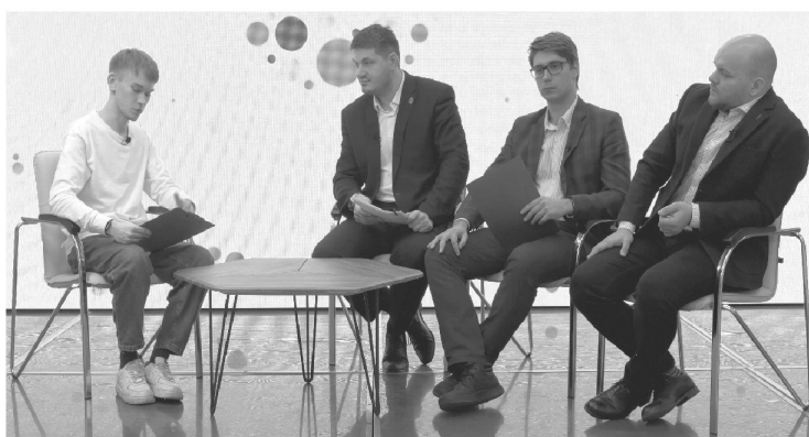
Неделя профилактических мероприятий объединила в себе круглые столы и социальные рейды в защиту подростков

Одним из главных мероприятий цикла стал круглый стол на тему профилактики экстремизма Дома дружбы. Здесь собрались более 100 человек, в первую очередь – представители системы образования. Вместе они